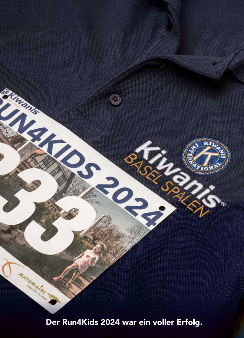
Der Run4Kids 2024 war ein voller Erfolg.