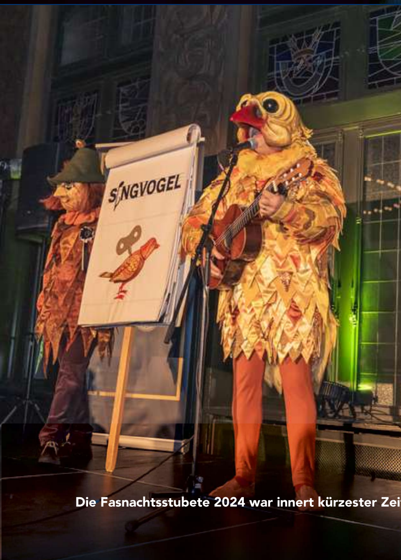
Die Fasnachtsstübete 2024 war innert kürzester Zeit ausverkauft.